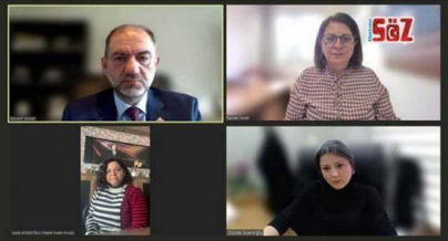
İstanbul Ticaret Borsası'nın düzenlediği 'Borsa Meydanı'nda Sektörler Konuşuyor' toplantılarında bu ay kooperatiftiklik ele alındı.