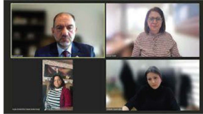
HABER-ARTIN ŞİRİN PINAR Borsa'da Kooperatiftiklik gündem oldu İstanbul Ticaret Borsası'nın Güvencir Ürün Platformu desteği ile düzenlenen 'Borsa Meydanı'nda Sektörler Konuşuyor' toplantılarında bu ay kooperatiftiklik ele alındı.